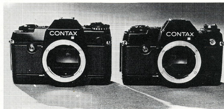
Så lidt forskel er der i det ydre mellem den nye Contax 137 MA (tv), som har lukkertidsindstilling placeret omkring tilbagespolingsknappen og Contax 137 MD.

nu er endnu hurtigere, idet den klarer op til 3 billeder/sek. Strømforsyningen til alle kameraets funktioner klares stadig af 4 stk. 1,5 volt penlight-batterier, som alt efter type kan klare 20-50 ruller film.