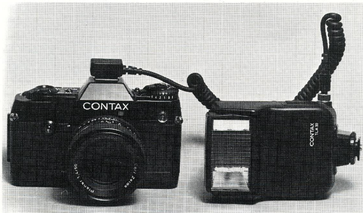
Flash-systemet har måling på filmplanet.